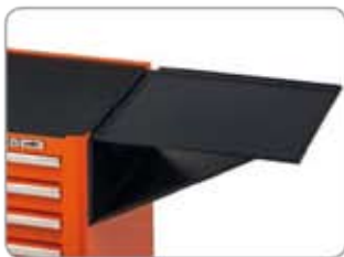
1470K-AC1 Asztallap toldás