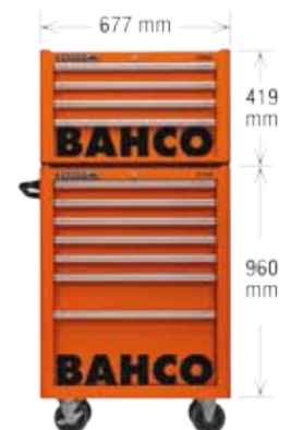
A 26"-os 1475K szerszámkocsi és a 1485K szerszámfeltét méretei