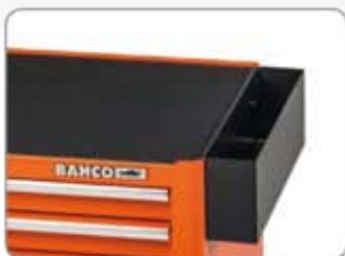
1470K-AC3 Spray tartó