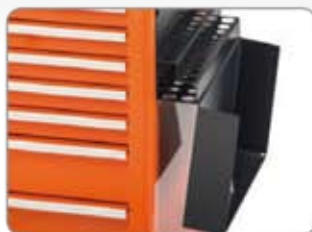
1470K-AC2 Szerszám tartó