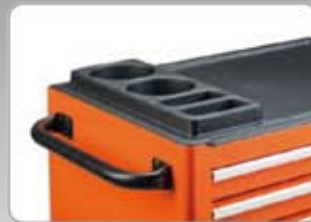
1470K-AC7 26" műanyag munkalap alkatrész tartóval