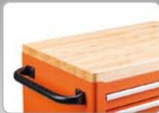
1470K-ACTW 26" Fa munkalap