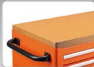
1470K-ACTD 26" MDF (farostlemez) munkalap