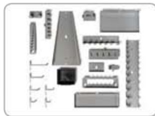
1495TP-XXX Különbféle kampók és akasztók