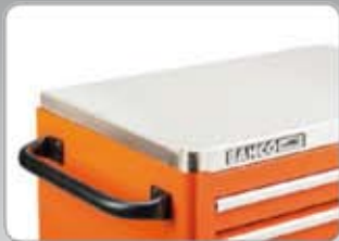
1470K-ACTSS 26" Rozsdamentes acél munkalap