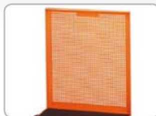
1470K-AC8 Perforált hátfal