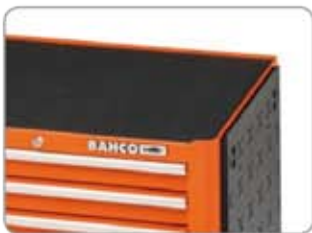
1470K-AC4SIDE Perforált oldalfal