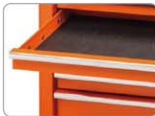
1470KAC01 Csúszásgátló fiókbetét