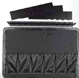
Blick in Einsatzschale mit Unterteilungen